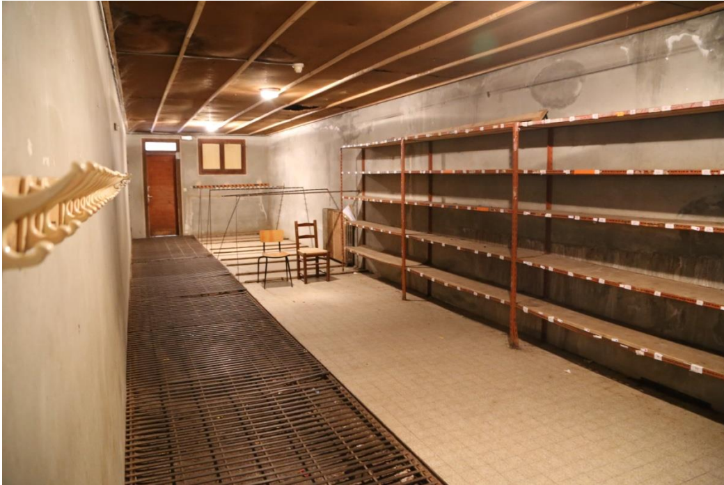
Le local à skis au chalet