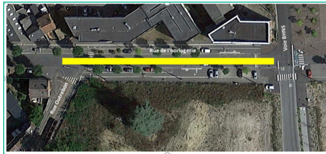
Zone de travaux

Les travaux dureront 4 semaines. Ces derniers consisteront en la pose de nouvelles canalisations.