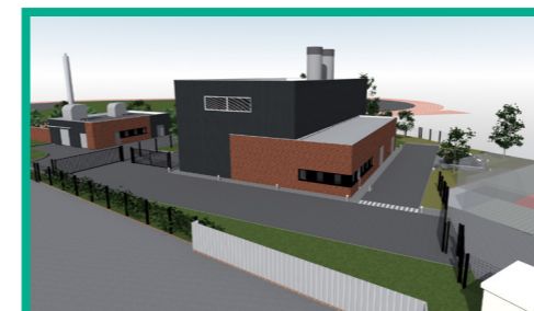
La future chaufferie au cœur du quartier du Mont-Liébaud

UNE ÉNERGIE VERTE, DURABLE ET INNOVANTE ISSUE DE NOTRE TERRITOIRE !