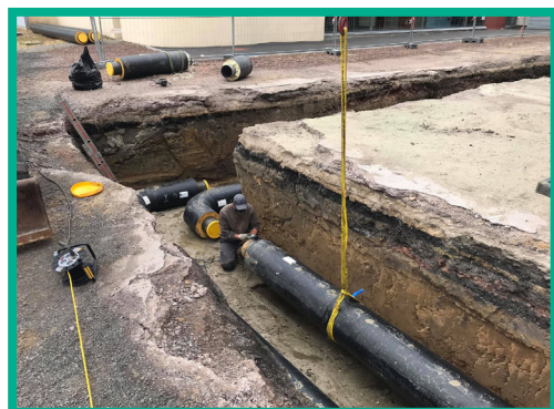
Pose de tuyaux adaptés au nouveau réseau de chauffage urbain