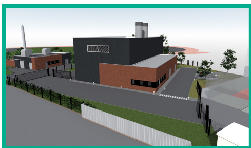
La future chaufferie au cœur du quartier du Mont-Liébaud

UNE ÉNERGIE VERTE, DURABLE ET INNOVANTE ISSUE DE NOTRE TERRITOIRE !