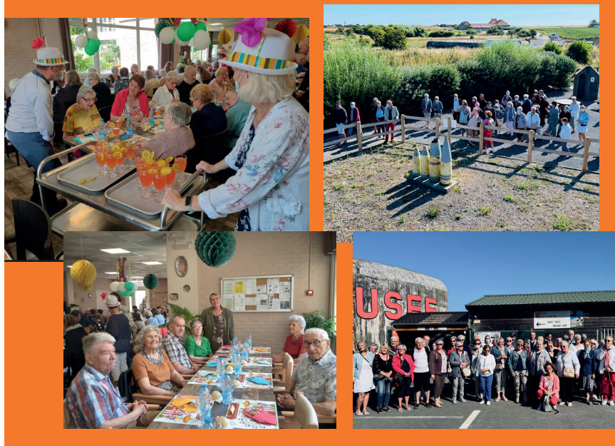
Le 28 juin dernier, la résidence Guynemer était en liesse à l'occasion d'un repas et d'un spectacle sur le thème du cirque.