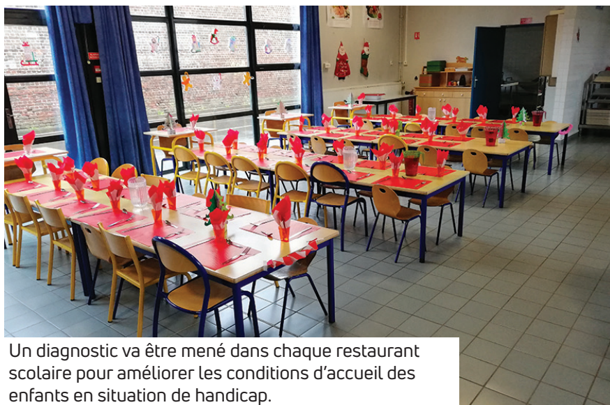
Un diagnostic va être mené dans chaque restaurant scolaire pour améliorer les conditions d'accueil des enfants en situation de handicap.

Dès la rentrée scolaire, l'association va former les animateurs et encadrants des structures jeunesse municipales. À cet effet, des malles pédagogiques seront mises à leur disposition.