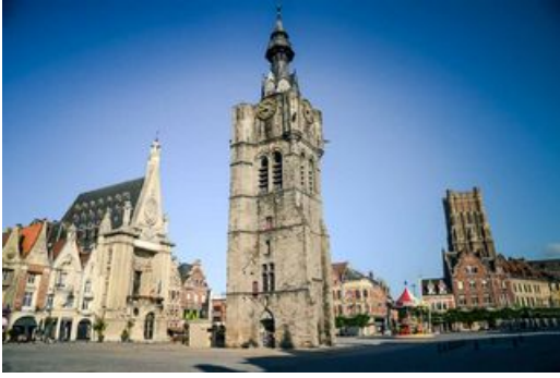
Le Belfroi