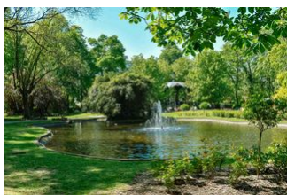
Le jardin public

Situé à proximité immédiate du centre-ville de Béthune, le Jardin public est un espace exceptionnel. Avec son plan d'eau et son kiosque classé, il est le lieu idéal pour flâner, se promener et se détendre.