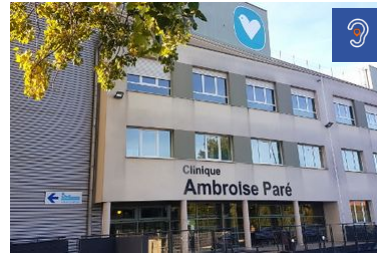
Clinique Ambroise Paré