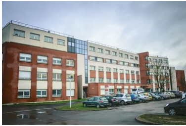
Clinique Anne d'Artois