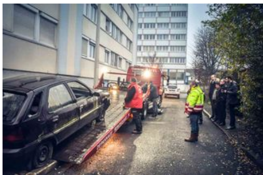
La fourrière municipale

Depuis le 1er janvier 2018, la ville s'est dotée d'un service de fourrière municipale. La procédure d'enlèvement a été confiée à une société privée. Si vous êtes gênés par des voitures ventouses, abandonnées, en stationnement dangereux ou gênant, vous pouvez faire appel à ce service.