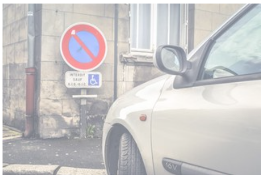
Stationnement personne à mobilité réduite