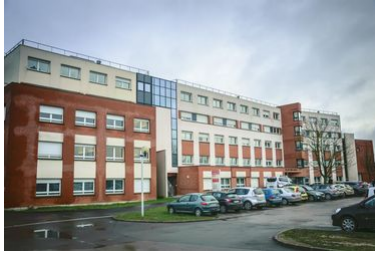
Clinique Anne d'Artois