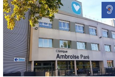
Clinique Ambroise Paré